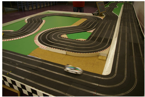
la piste montée à la Maison des Associations de Tinquex en décembre 2009